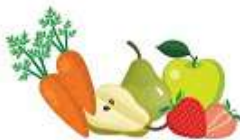
ФРУКТЫ И ОВОЩИ