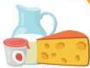
МОЛОКО, ЙОГУРТ И СЫР